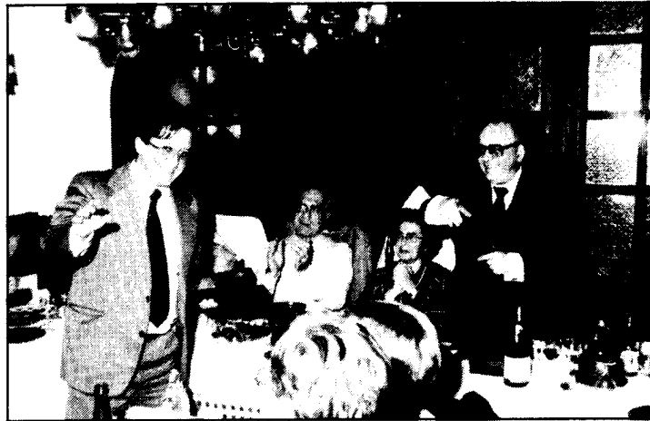
El Sr. Garriga con su trofeo.

como el aspecto de nuestro Boletín y sus problemas o contenido.